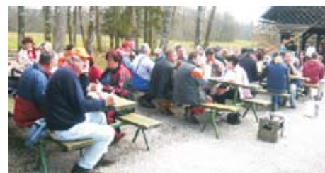
Tradicionalna spomladanska čistilna akcija z namenom čiščenja črnih odlagališč in osveščanja ljudi glede ohranjanja čistega okolja je več kot dobro uspela, saj smo napolnili pet velikih zabojnikov odpadkov. Udeleženci smo po vsej KS Raka zbrali čez 30 m3 odpadkov.