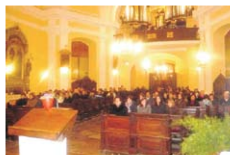
Ob slovenskem kulturnem prazniku smo v farni cerkvi svetega Lovrenca na Raki organizirali koncert Primorskega akademskega zbora Vinko Vodopivec.