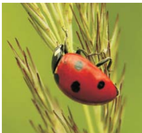
Narava – velika neznanka.

Svojo razgibanost in bogastvo kaže v mehko zaobljenih grčih, skrivnostnih gozdovih, vijugastih potočkih, različnih živalskih in rastlinskih vrstah, v naravnih umetnijah, ki so se pod različnimi vplivi oblikovale skozi stoletja, v zgradbah, ki so jih v davni preteklosti zgradile pridne roke človeka, ko so ljudje bili še odvisni od narave in z njo živeli v sožitju. Narava skriva neokrnjene koticke, ki presenečajo z biotsko raznovrstnostjo. Več jo je, boljše je tudi naše počutje in zdravje.