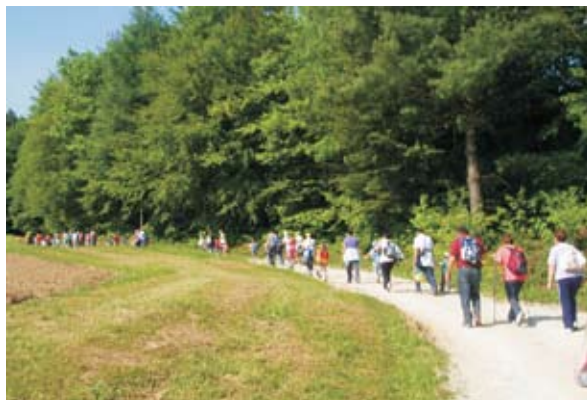
Utrinek s pohoda ob otvoritvi pešpoti Pikapolonica, 9. 5. 2009

Poti bosta razkrili še marsikatero skrivnost. Nanju se bomo podali z razmišljanjem in zavedanjem, da je sobivanje in soodvisnost pomemben dejavnik v ohranjanju ravnovesja med živim in neživim delom naše bivanjske kulture. S tem spoznanjem bomo srečnejši, zadovoljnejši, bolj zdravi, hkrati pa bomo imeli večje možnosti preživetja v času nenehnih naravnih in človekovih sprememb.