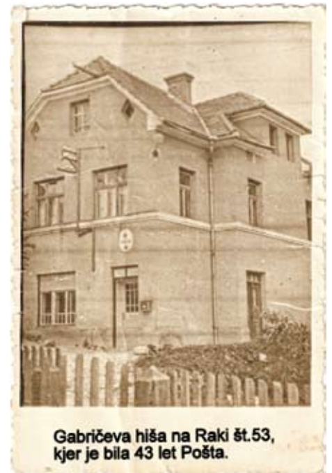
Gabričeva hiša na Raki št. 53, kjer je bila 43 let Pošta.

Za hiter prenos sporočil so tedaj na pošti uporabljali Morsejev aparat. Največ so z njim komunicirali s pošto v Krškem. Leta 1938 so na pošti dobili telefon. Po 2. svetovni vojni so imeli poleg pošte na Raki telefone še Postaja